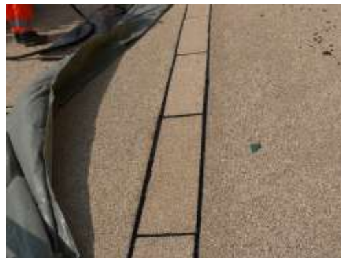
Bilder 2 bis 5: Beispielbilder bereits gebauter Objekte