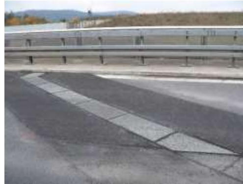
Bilder 6 und 7: Beispielbilder bereits gebauter Objekte